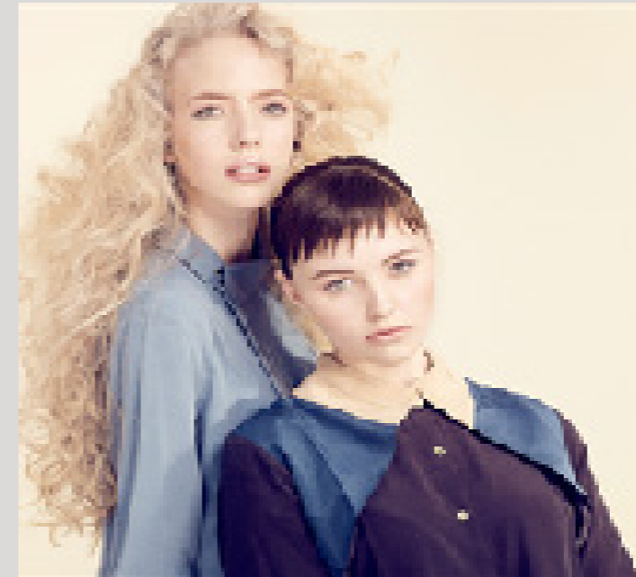
Danish Beauty Awards Dommere: "Rent, tidløst og med lidt kant"